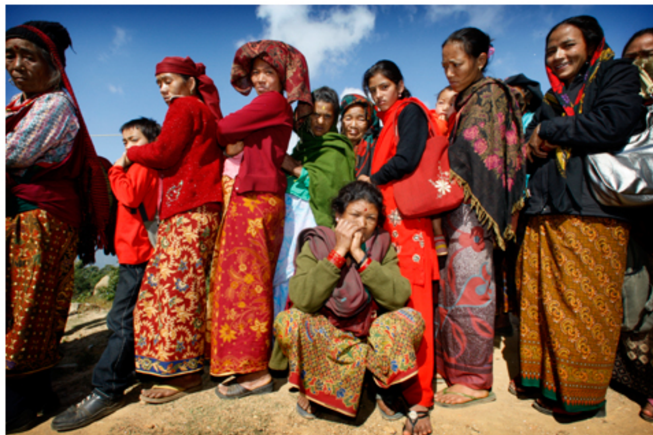
Gezochtes van elkaar wachten mannen en vrouwen op de overname van hun ogen bij de polikliniek.