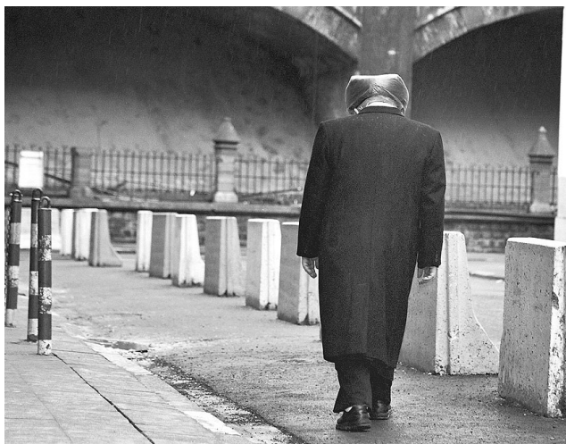
• Orthodoxe Jood in Antwerpen.