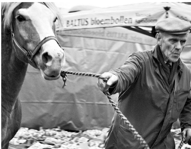
• De jaarlijkse paardenmarkt in Hedel.