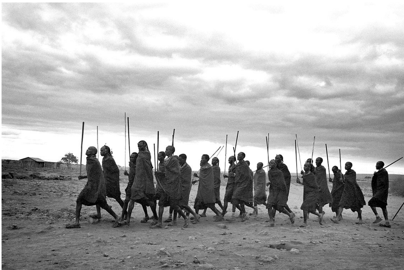
• Masaï-gemeenschap uit het Keniase dorp Amboseli.

Mariëlle van Uiterst.