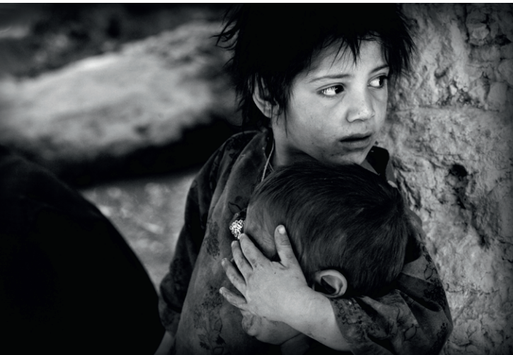
▲ Afghanistan/Chora | Een meisje beschermt haar broertje als Nederlandse ISAF-militairen door het dorp patrouilleren.

Het interview verloopt een beetje chaotisch. Marielle is in haar enthousiasme niet te stuiten en dat staat een keurig gestructureerd vraaggesprek soms in de weg. Maar uit alles spreekt een grote gedrevenheid en passie voor het fotojournalistieke vak. Dat laatste was altijd al – misschien sluimerend – aanwezig, zegt zij. "Mijn opa was anti-NSB en kwam daardoor tijdens de Tweede Wereldoorlog terecht als gevangene in Kamp Vught. Hij heeft daarover nooit gesproken, maar ik wilde onbewust die verzwegen verhalen zelf invullen en ontsluiten. Daarmee is misschien het journalistieke zaadje geplant."