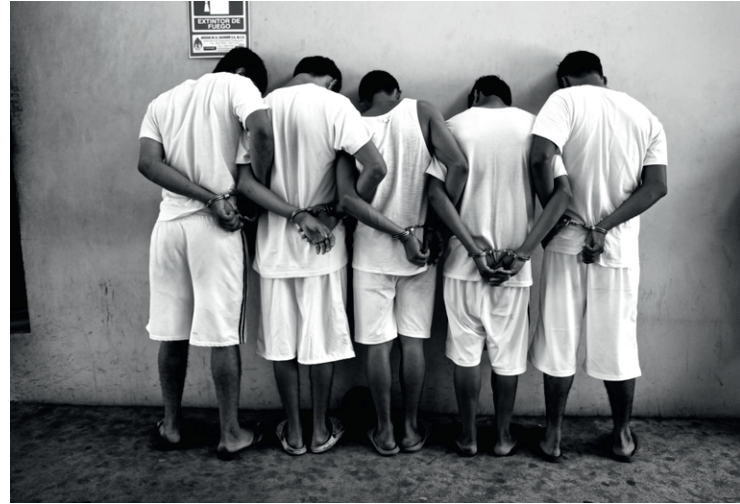
▲ El Salvador | Na een moordslag op twee politieagenten wordt de jacht geopend. Jongeren worden uit de dorpen getrokken en zonder proces vastgehouden.

De vele reportages hebben haar – naast de nodige kopzorgen – publicaties in een keur van media in binnen- en buitenland opgeleverd. Van Nieuwe Revu tot NRC, het Parool, Trouw, Volkskrant, New York Times, Wall Street Journal, die Welt, BBC en diverse edities van National Geographic Magazine. Bij de National Geographic Magazine-edities betrof het haar werk ná de ommekeer in Mexico. Na een ‘adempauze’, gooide zij het over een geheel andere boeg. Haar liefde voor dieren in het algemeen en honden in het bijzonder, zorgde voor de keuze voor een ander onderwerp: ze ging de wolf in binnen- en buitenland volgen met haar camera. “Ik bepaal waarmee en hoe lang ik daarmee bezig ben. Bijvoorbeeld hoe lang ik in de bossen zit om de wolf te fotograferen. Omdat je de tijd kunt nemen, ontstaan er echt mooie verhalen.” Zij heeft onder andere de wolven in Nederland gefotografeerd, waaronder de inmiddels doodgeschoten ‘Bram de Wolf’. Maar ook in België, Duitsland en zelfs Brazilië (de zogenoemde ‘gemaande wolf’) en Ethiopië (“samen met een groep biologen in de bergen op 4000 meter hoogte wolven vangen en taggen”), heeft zij de dieren vastgelegd. Naast de nodige publicaties, brengt zij binnenkort een bijzonder boek uit over de wolf.