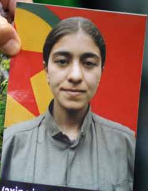
(axin viyan) hicran gersiyor